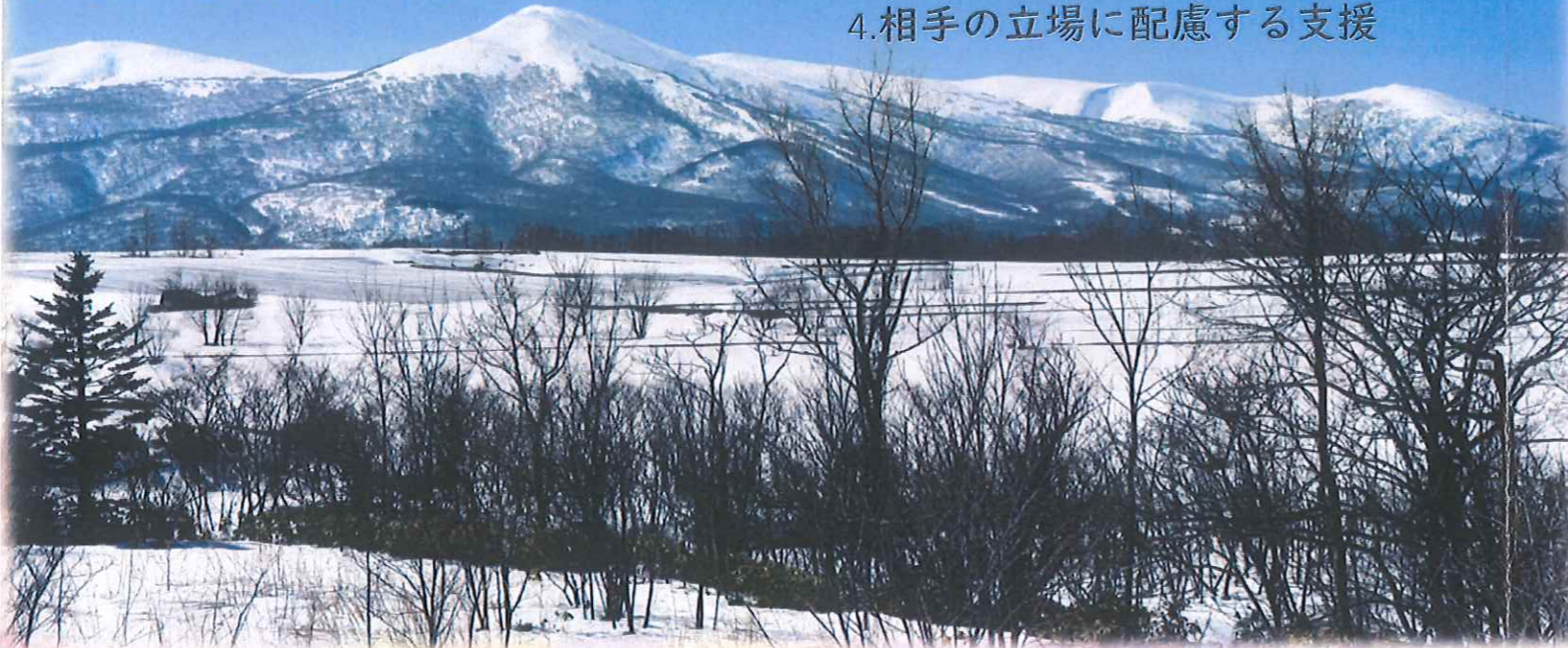
リビングから見えるニセコ連峰